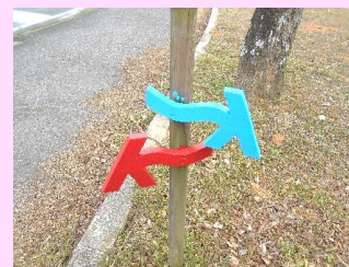
オルレコースの 目印