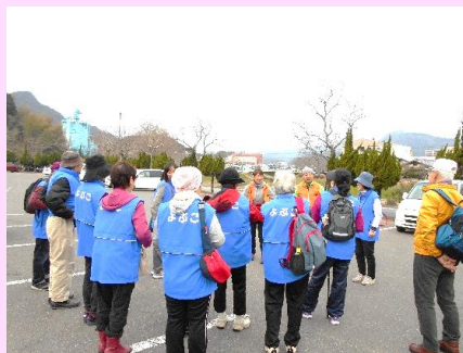
武雄:オルレコースをウォーキング