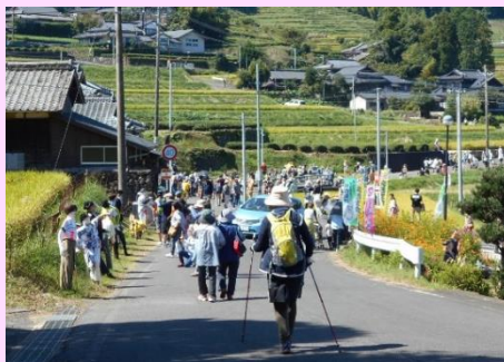
波佐見:JRのウォーキングに参加

健康づくりと地域交流のため、年に2回ウォーキング事業を実施しています。 平成29年度は波佐見市と武雄市に行きウォーキングを行いました！