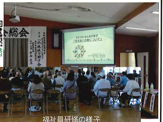
福祉員研修の様子